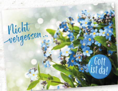
KP254 mit 3D-Button als Vergewisserung in unsicheren Zeiten