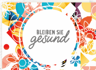
GK280 für Begegnungen im Alltag