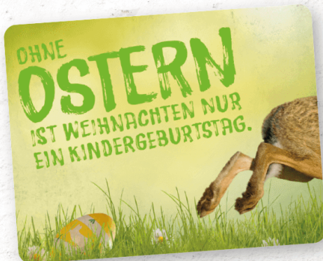
PK259 für Weiter-Denker

Kontakt halten Hoffnung verbreiten Freude schenken