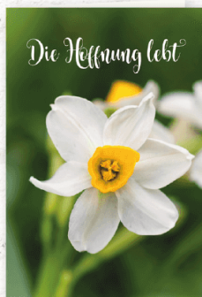
GK290 auch zu Ostern

Kontakt halten Hoffnung verbreiten Freude schenken